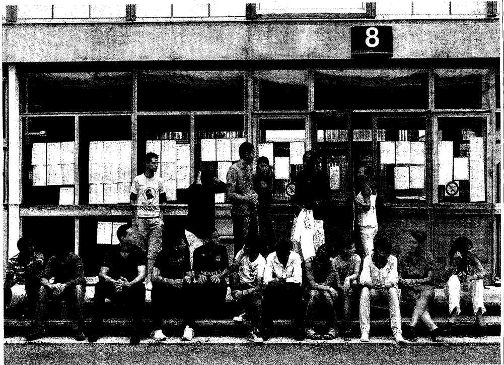
Elèves de l'école d'été à l'Insa de Lyon, vendredi. C'est la deuxième année que l'académie de Lyon propose ce dispositif.