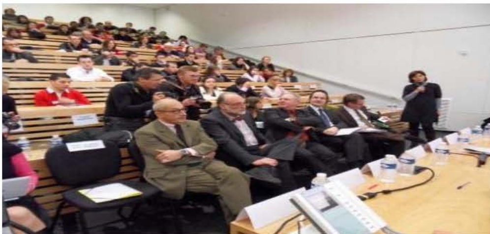
le Centre Diversité et Réussite – INSA de Lyon

Une Table ronde s'organisait dans la foulée pour évoquer de l'amont à l'aval l'organisation de cette politique de la Diversité et de l'Egalité des Chances afin, de susciter les ambitions et soutenir la réussite.